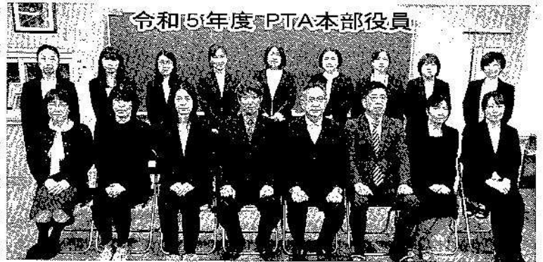
令和5年度 PTA本部役員

子供たちの教育・育成に関する活動を行う組織です。子供の育成は学校教育のみで済まされるものではありません。やはり、家庭教育・地域教育・学校教育の連携によって支えていくものであると思います。PTAは、子供たちが健康やかに育ち、社会に貢献できるように支援する重要な組織であり、私たちはその使命に真摯に取り組みたいと思います。また、生徒たちとも連携し、彼等の声に耳を傾けながら活動を進めていきます。生徒たちのアイデアや意見を取り入れながら、彼等がより良い学校生活を送れるような支援を行ってまいります。 最後に、PTA活動を通して、生徒たちが社会に貢献できるように、力を尽くしてまいります。保護者の皆様や地域の皆様からのご支援・ご協力をお願い申し上げます。生徒たちの成長と発展に向けて、一丸となって取り組んでまいります。西中PTA活動へのご理解・ご協力よろしく願います。