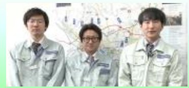
令和4年度 災害チームメンバー

秋山川で実施している河川激甚災害特別緊急事業も令和元年度の着手から4年が経過しました。これまで、皆様の御協力を賜りながら、全体事業費約60億円のうち、8割を超える事業費を執行しております。今年度は、幸い雨が少なかったこともあり、順調に工事を進めることができました。落橋していた中橋の工事も進み、12月には天明小学校の生徒を招き、現場見学会を実施しました。そして、3月に工事が完了し、3月31日、無事開通を迎えました。また、県道桐生岩舟線、大橋の架け替え工事にも取りかかり始めました。現在は、架け替えに際し、必要となる仮橋の整備を進めております。今後、現在の橋を取り壊し、新しい橋を架ける工事を令和7年度の完成を目標に事業を実施していく予定です。なお、これまで秋山川の事業は「災害チーム」が担当しておりましたが、令和5年度からは「整備第二課」に業務を引き継ぎます。引継ぎ後も、鋭意事業を推進して参りたいと考えておりますので、引き続き、御理解と御協力の程、よろしくお願いたします。